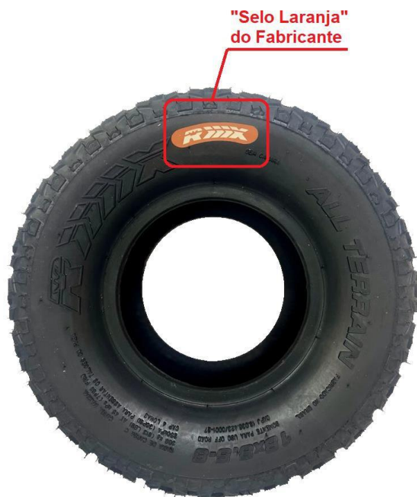
Imagem 1 – vista do pneu traseiro de uso obrigatório

8.2.1.2 - Cada piloto ou dupla de pilotos deverá apresentar aos comissários “no mínimo 3 e no máximo 4 pneus traseiros novos e sem uso” , em conformidade com o Regulamento Técnico da Categoria, para serem lacrados e sorteados entre os participantes. Será permitida somente a utilização dos pneus descritos no artigo 11.4 do Regulamento Técnico da Categoria, e que devem possuir obrigatoriamente o “selo laranja” do fabricante conforme Imagem 1, abaixo.