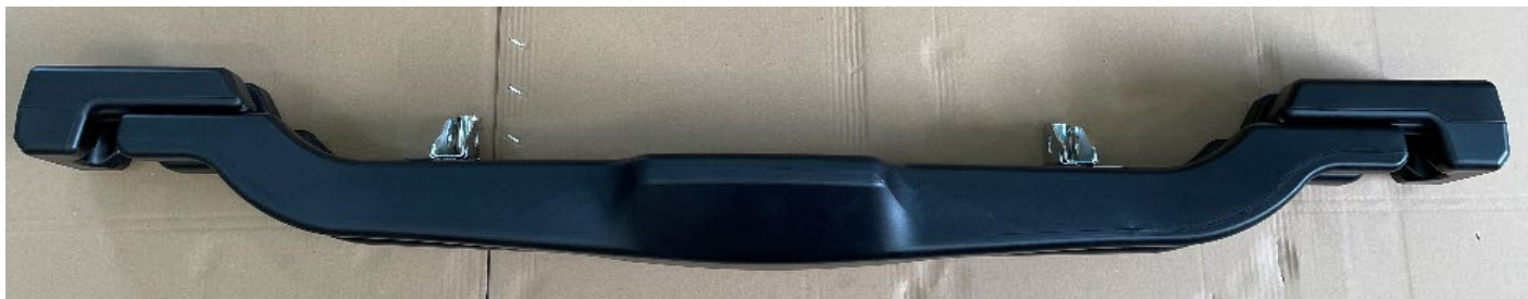
Photos vue de côté avec supports / Photos from the side with supports