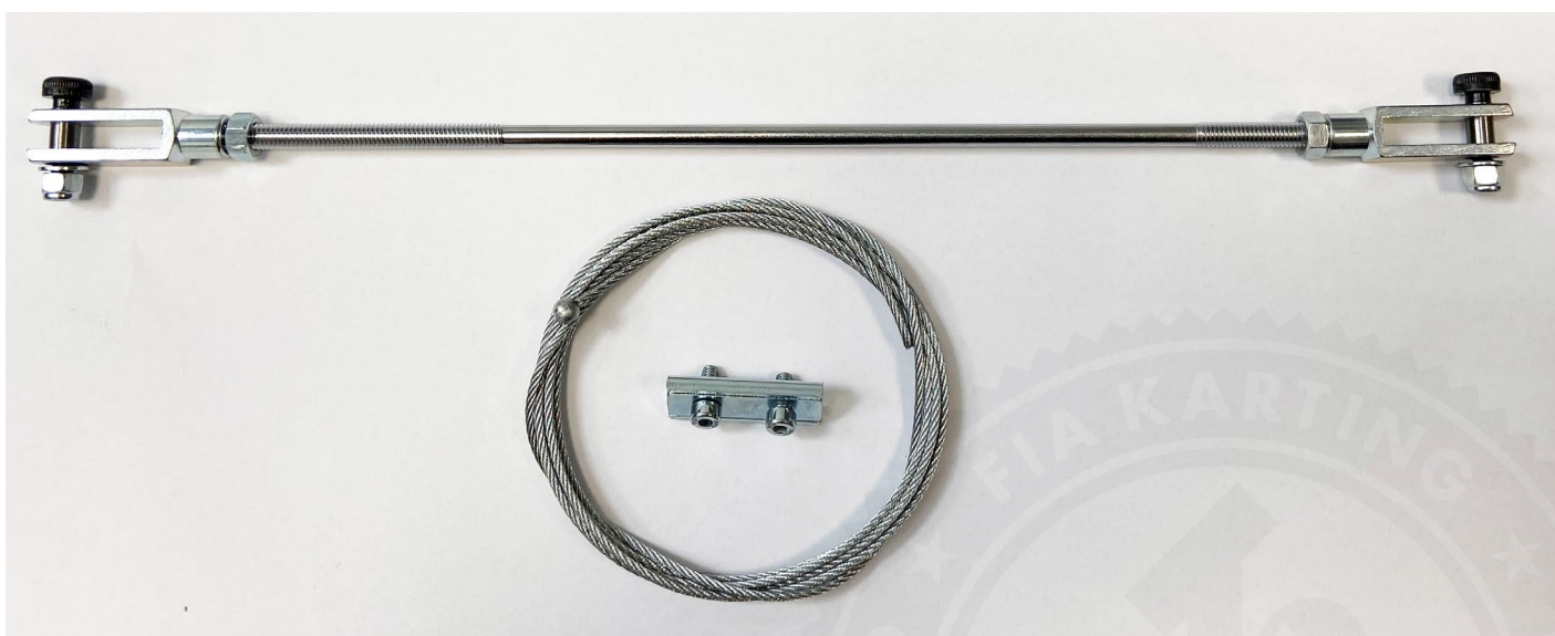
Photo du câble de la commande de freinage / Photo of brake control cable

La commande de freinage doit être isolée du châssis et montrer la double commande. / The brake control must be separated from the chassis and the double linkage must be shown.