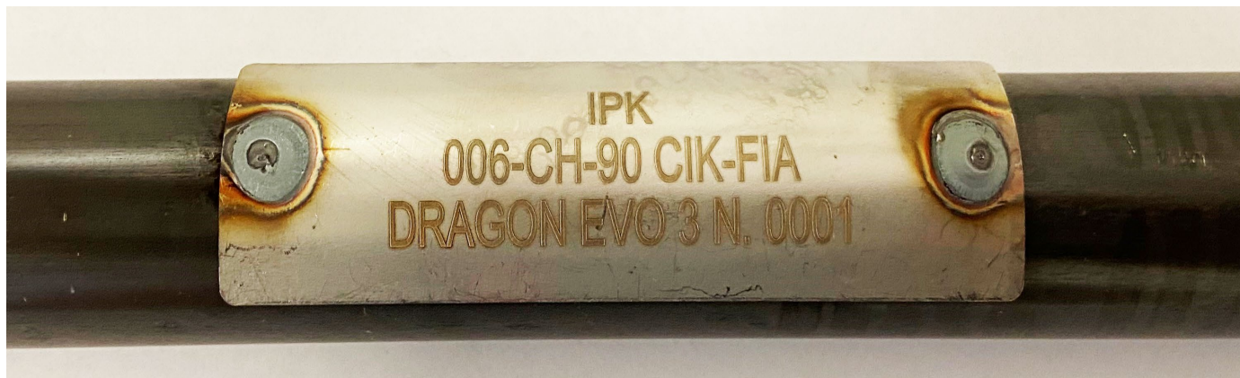
Photo du marquage du numéro d'homologation / Photo of the homologation number marking

Le marquage indiqué sur le tube transversal arrière doit rester clairement visible en permanence. / The marking located on the rear strut must be clearly visible at all times.