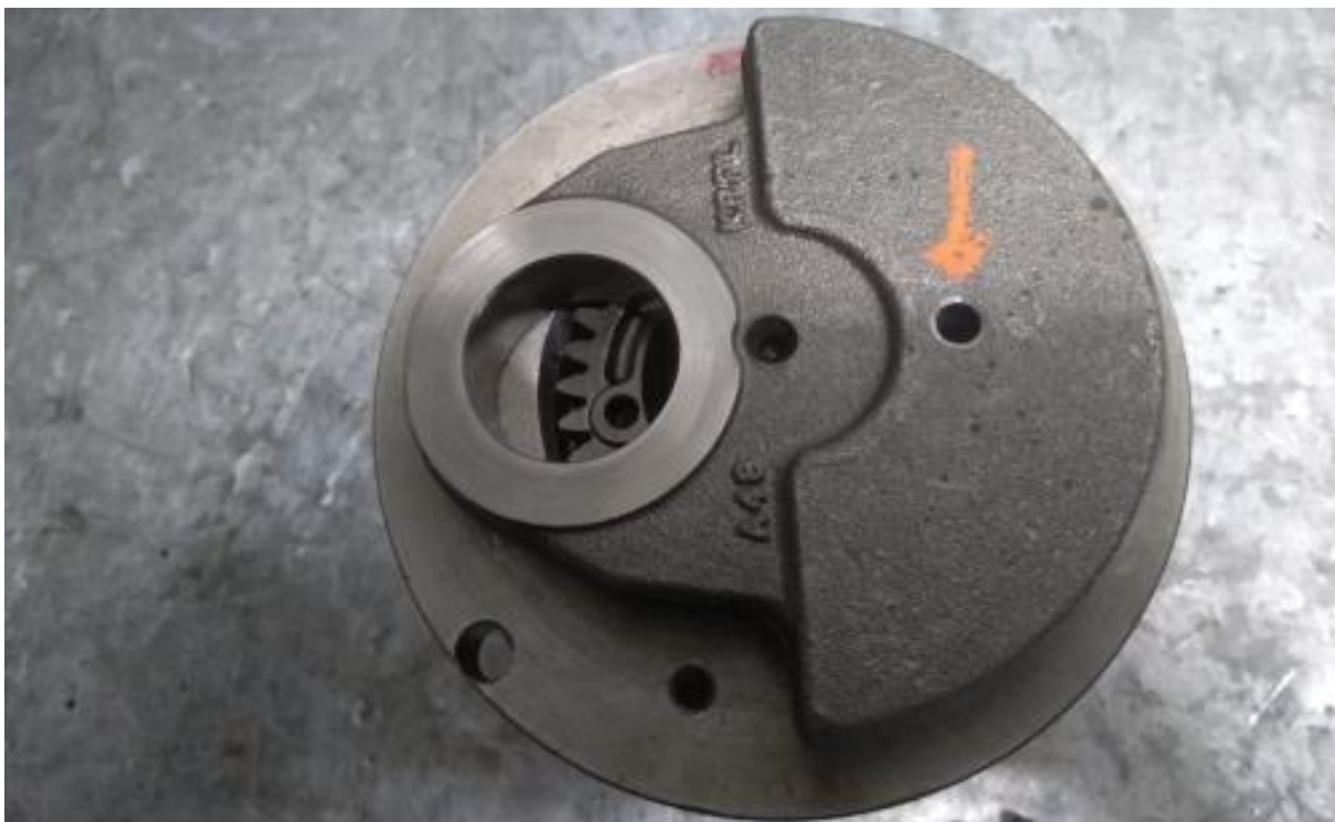
Imagem 3 – detalhe do furo na bolacha do virabrequim