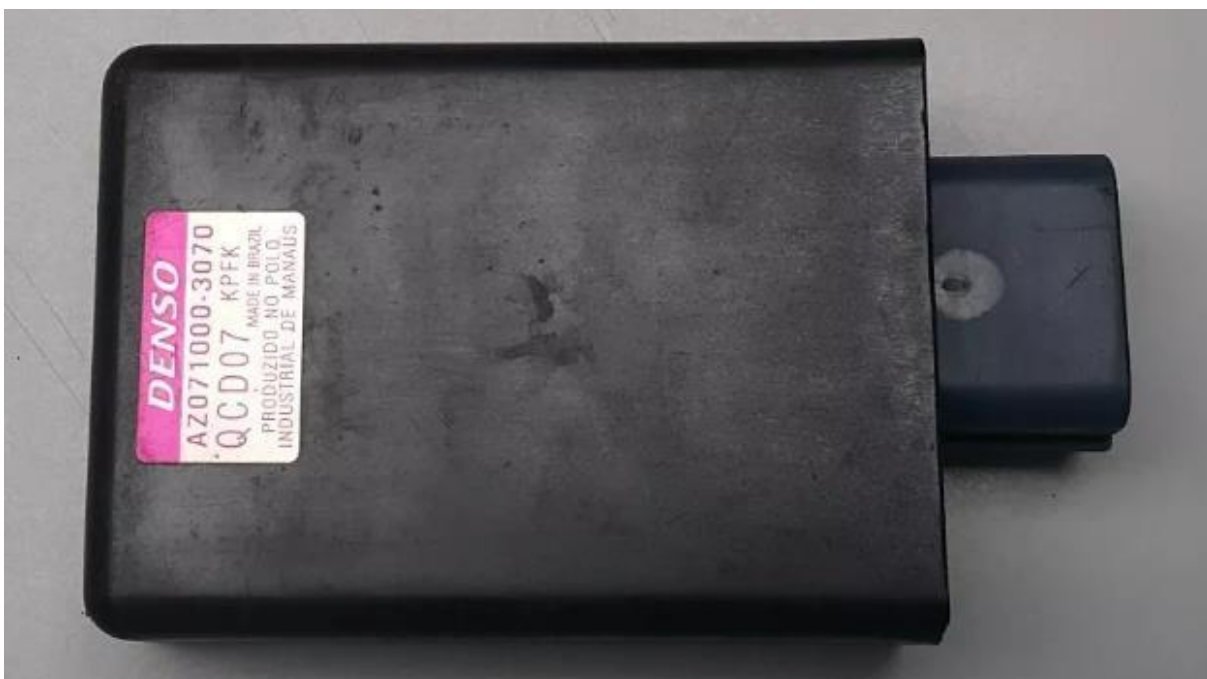
Imagem 6 – Identificação da CDI na cor obrigatória.

6.1.5 - CDI – Original do motor (conforme especificação do fabricante). É obrigatório que a CDI tenha a etiqueta original na cor Vermelha (Vinho), como exemplificado na Imagem 6, abaixo.