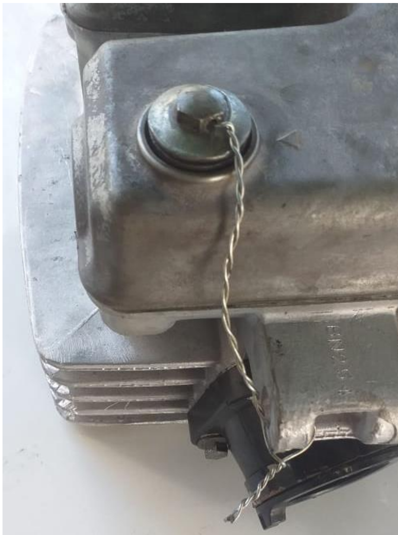
Imagem 2 – Detalhe furo passante no parafuso do cabeçote

4.3 - COMANDO DE VÁLVULAS - Original do modelo ou paralelo desde que tenha as mesmas características e medidas dos originais. Permitido sacar as engrenagens e alterar o ponto.