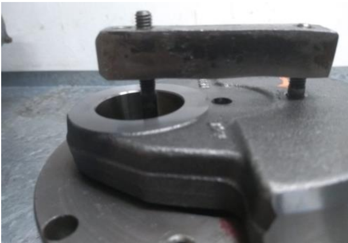
Imagem 5 – detalhe do saque da engrenagem com auxílio do furo e da ferramenta