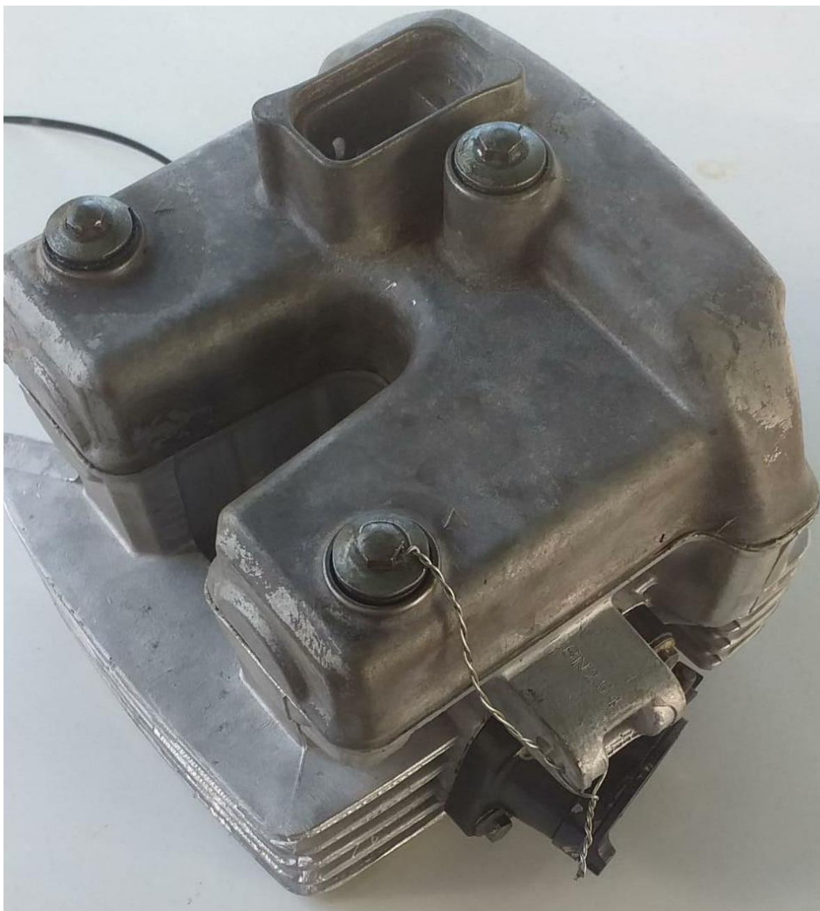
Imagem 1 – Detalhe furo passante no parafuso do cabeçote