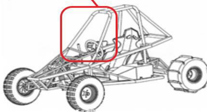
Imagem 7 – Localização da posição de instalação dos faróis dianteiros.

Local para a instalação dos faróis dianteiros