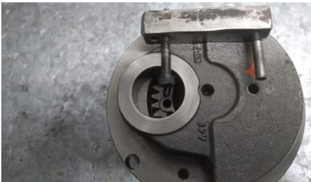
Imagem 4 – detalhe do furo na bolacha do virabrequim com ferramenta de saque