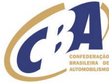
Figura 1 – Identificação dos espaços obrigatórios, reservados para CBA e patrocinadores do campeonato

19.3 - Todos os pilotos serão obrigados a usar no macacão, as logomarcas fornecidas pelos patrocinadores do Campeonato ou da Etapa em posição conforme a Figura 2 abaixo.