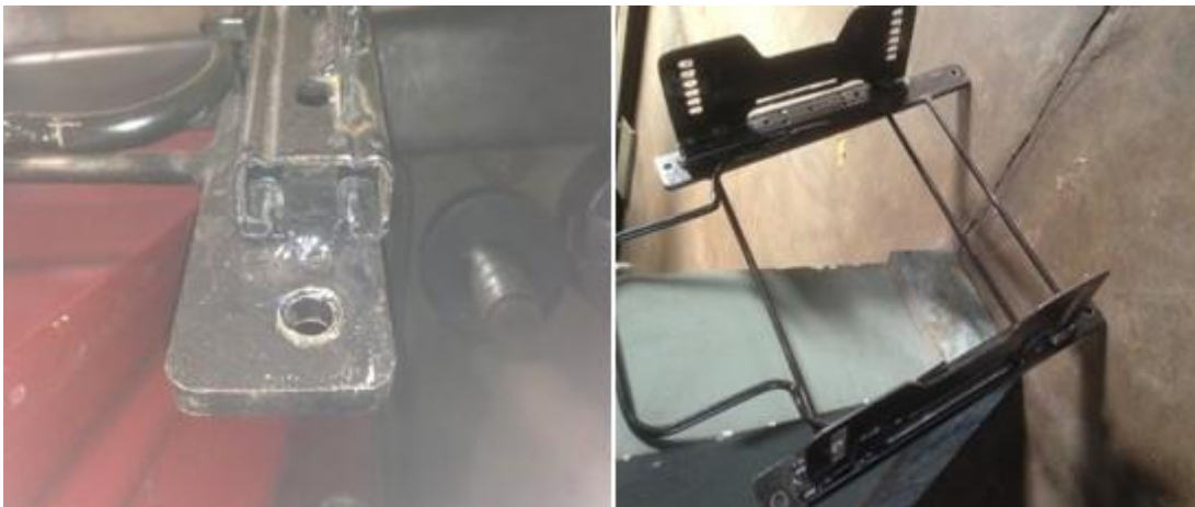
Suporte do Banco com regulagem (Sugestão)