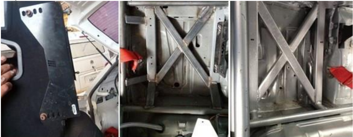
Suporte do Banco (Fixação Lateral) / Prolongamento Santo Antonio p/ fixação do banco

Se forem utilizados bancos com regulagem, o mesmo deverá ser fixado conforme artigo 16 do anexo "J" da FIA com calhas de aço e chapas de no mínimo 3mm, com fixações e travas eficientes. Exemplos fotos abaixo: