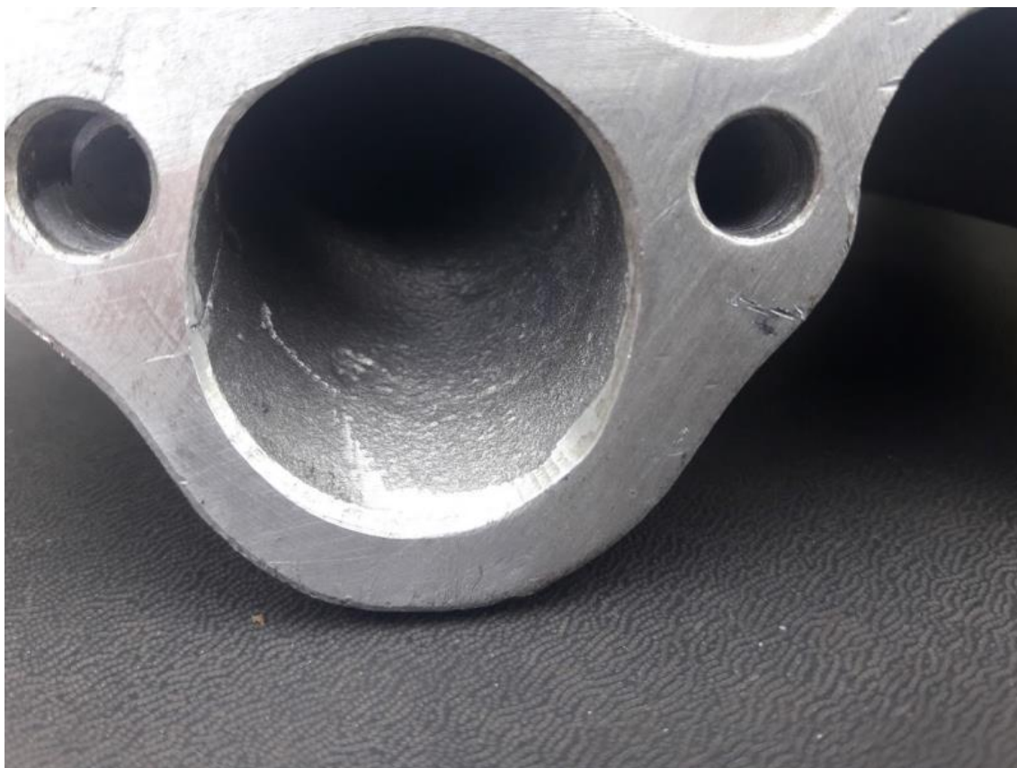
Imagem 1 – rasqueteamento proibido pelo Regulamento Técnico