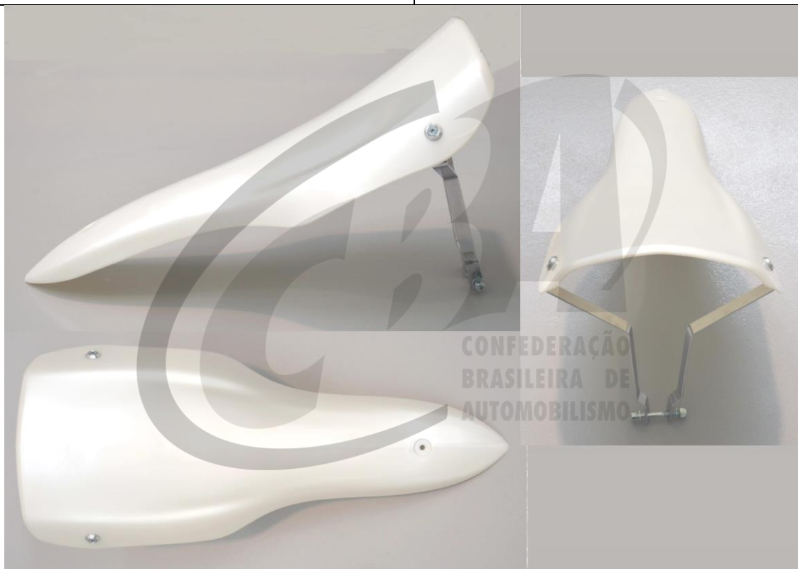
PHOTOS VUE DE DEVANT, DE DESSUS ET DE COTÉ, DU PANNEAU FRONTAL ET SUPPORTS PHOTO FROM FRONT, ABOVE AND SIDE OF FRONT PANEL WITH SUPPORTS

This Homologation Form reproduces descriptions, illustrations and dimensions at the moment of the CIK-FIA homologation.