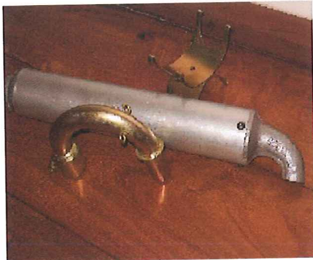
Foto do Abafador