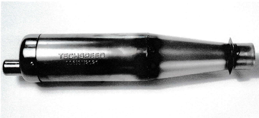
FOTO DO ESCAPAMENTO MOSTRANDO A MARCA ESTAMPADA

Essa ficha reproduz descrições, ilustrações e dimensões do escapamento no momento da homologação pela CBA. O fabricante poderá não modificá-la. Somente a ficha de homologação poderá servir para identificar um produto homologado.