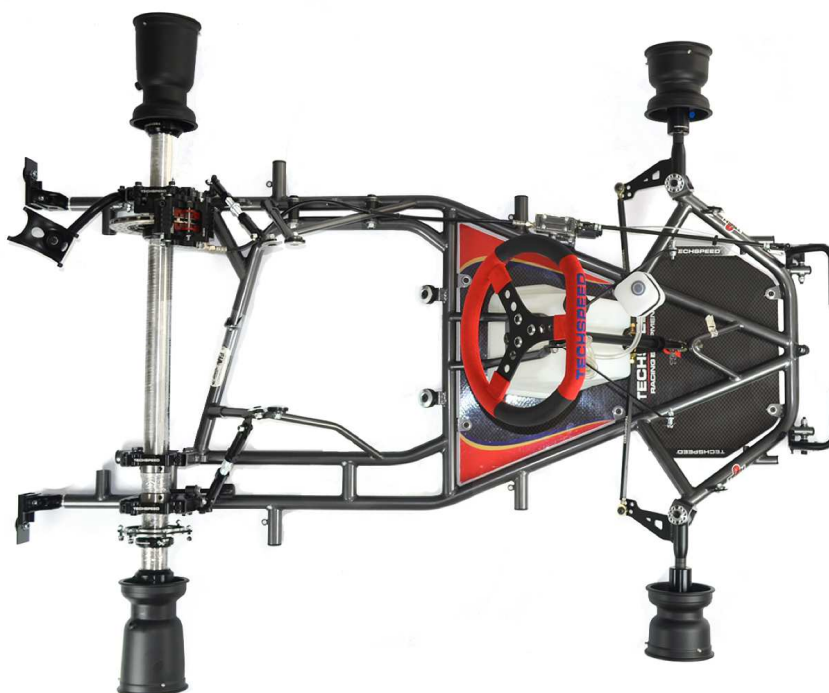
PHOTO VUE DE DESSUS DU CHÂSSIS COMPLET IDENTIQUE À L'UN DES MODÈLES PRÉSENTÉS À L'HOMOLOGATION SANS PARE-CHOCS, CARROSSERIE, SIEGE, NI PNEUMATIQUES

This Homologation Form reproduces descriptions, illustrations and dimensions of the chassis frame at the moment of the CIK-FIA homologation. The Manufacturer may modify them by Extension, but only within the limits set by the CIK-FIA Regulations in force.