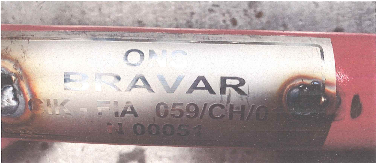
Photo du marquage du numéro d'homologation / Photo of the homologation number marking

Le marquage indiqué sur le tube transversal arrière doit rester clairement visible en permanence. / The marking located on the rear strut must be clearly visible at all times.