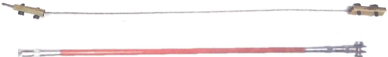
Photo du câble de la commande de freinage / Photo of brake control cable

La commande de freinage doit être isolée du châssis et montrer la double commande. / The brake control must be separated from the chassis and the double linkage must be shown.