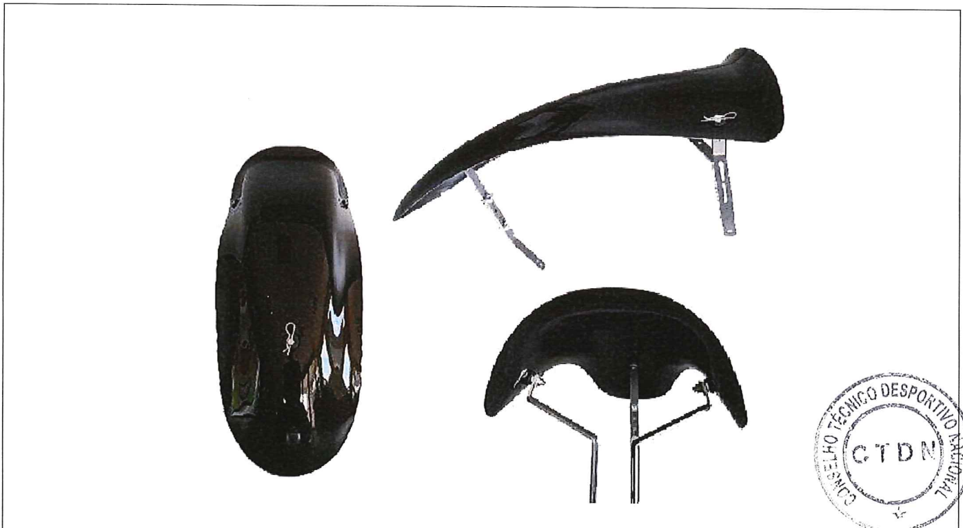
FOTO FRONTAL, SUPERIOR E LATERAL DO PAINEL SUPERIOR DIANTEIRO (GRAVATA) COM SUPORTES E FIXAÇÕES.

Essa ficha reproduz descrições, ilustrações e dimensões do painel superior dianteiro (gravata) no momento da homologação pelo CNK/CBA. O fabricante poderá modificá-las, mas somente dentro dos limites fixados pelos regulamentos FIA Karting e da CNK/CBA em vigor. Somente a Ficha de Homologação poderá servir para identificar um produto homologado.