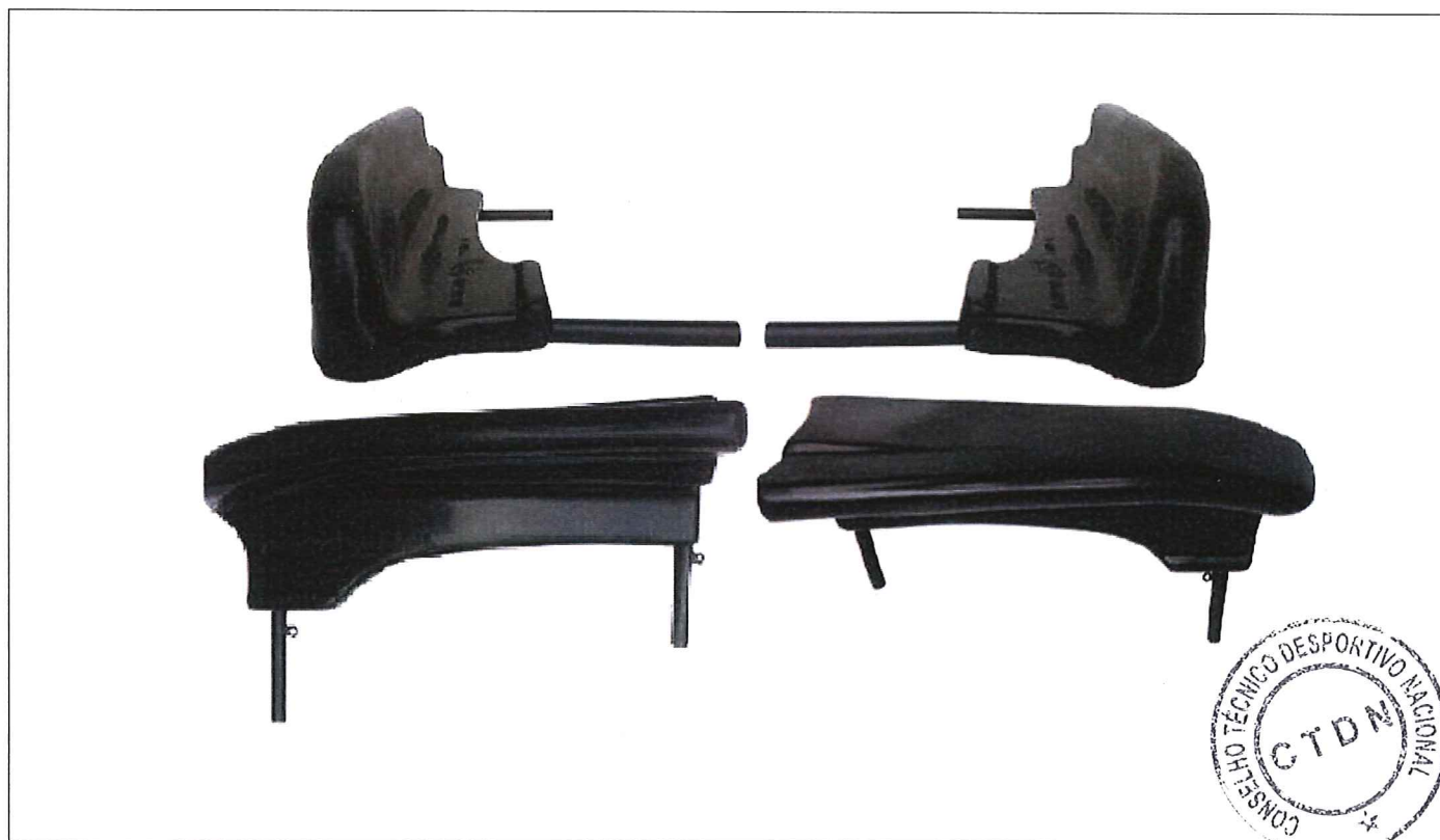
FOTO FRONTAL, SUPERIOR E LATERAL DAS CARENAGENS LATERAIS COM SUPORTES E FIXAÇÕES.

Essa ficha reproduz descrições, ilustrações e dimensões das carenagens laterais no momento da homologação pelo CNK/CBA. O fabricante poderá modificá-las, mas somente dentro dos limites fixados pelos regulamentos FIA Karting e da CNK/CBA em vigor. Somente a Ficha de Homologação poderá servir para identificar um produto homologado.